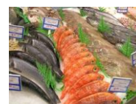
TRAZABILIDAD Y COMERCIALIZACIÓN