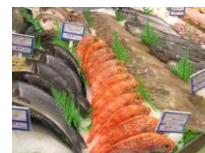
COMERCIALIZACIÓN Y TRAZABILIDAD